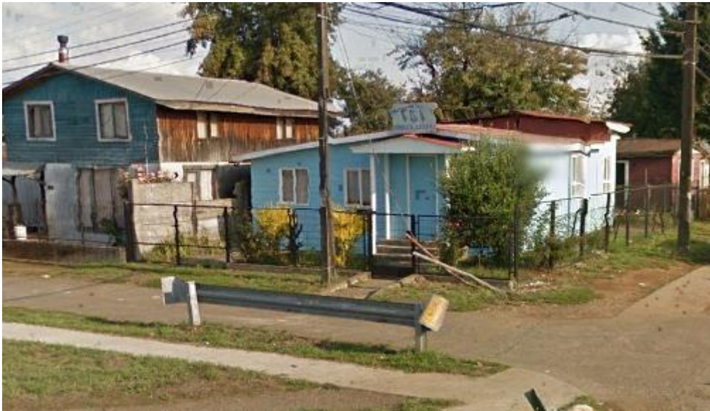
Imagen 7. Congregación Profética Israelita Osorno (2016)