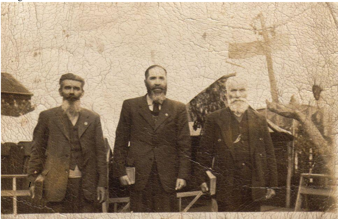
Imagen 2. Celebración de cabañas en Cunco 1911 aprox.