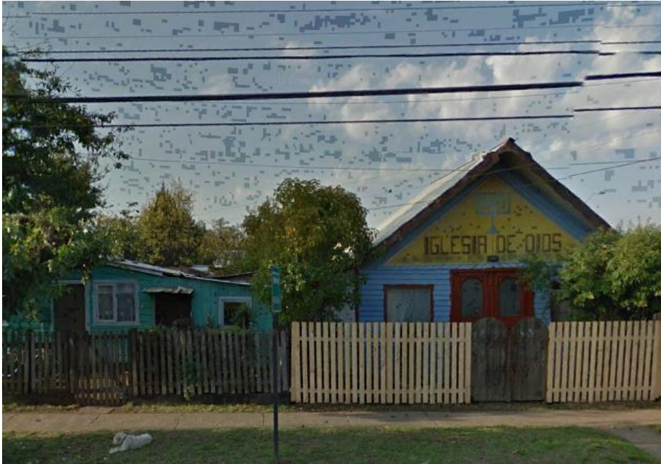
Imagen 8 Iglesia de Dios Israelita (2016) Osorno.