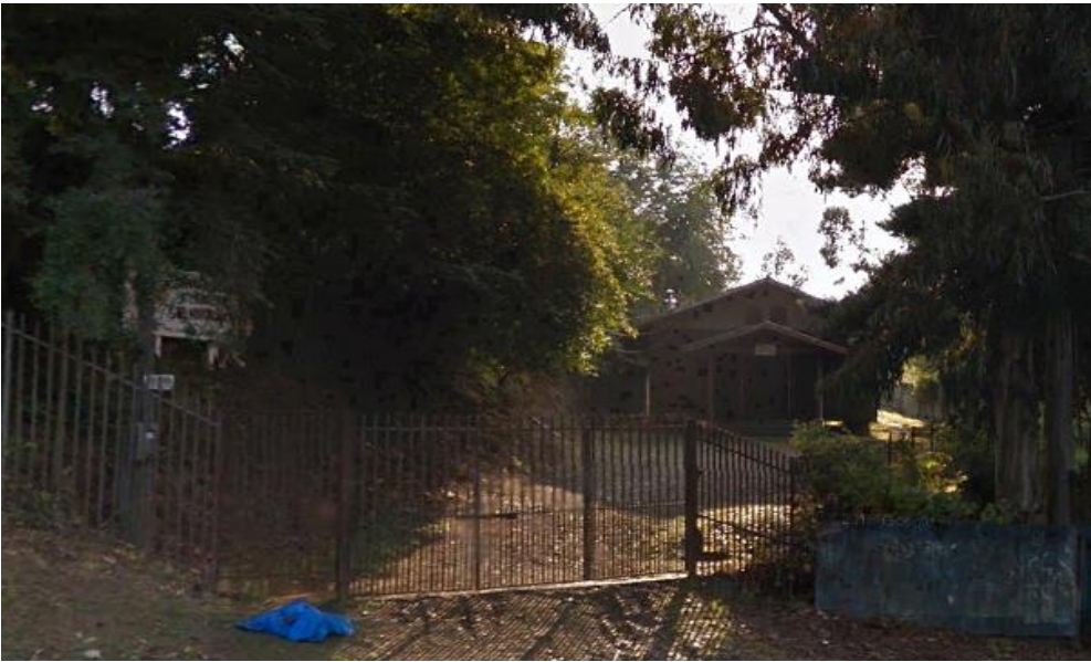
Imagen 9. Congregación Israelita del Nuevo Pacto (2013), Osorno.