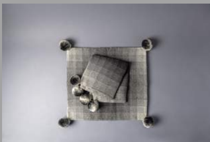
Glomira Celedonia Choque Castro Conjunto de piecera y cojín Quisa